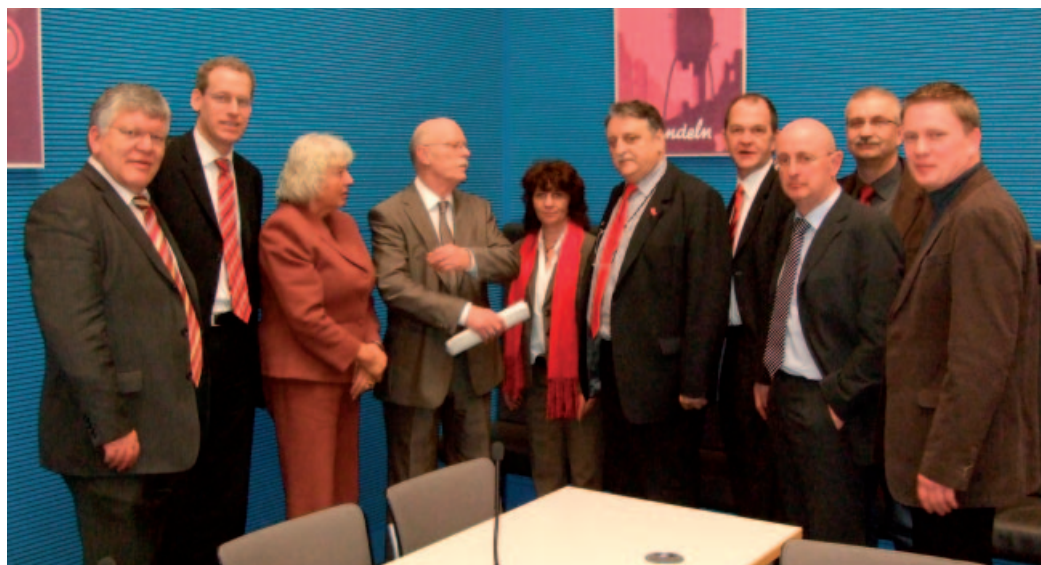
Tür geöffnet für Staatshilfe: Bei einem Treffen in Berlin am 12. 2. mit Schaeffler-Betriebsräten, IG Metall-Vertretern und Kommunalpolitikern hat die Spitze der SPD-Bundestagsfraktion Staatshilfe unter Auflagen befürwortet.