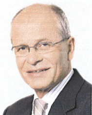
Berthold Huber, Erster Vorsitzender der IG Metall, über die Arbeitgeber- reaktion auf die Tarifforderung von acht Prozent.